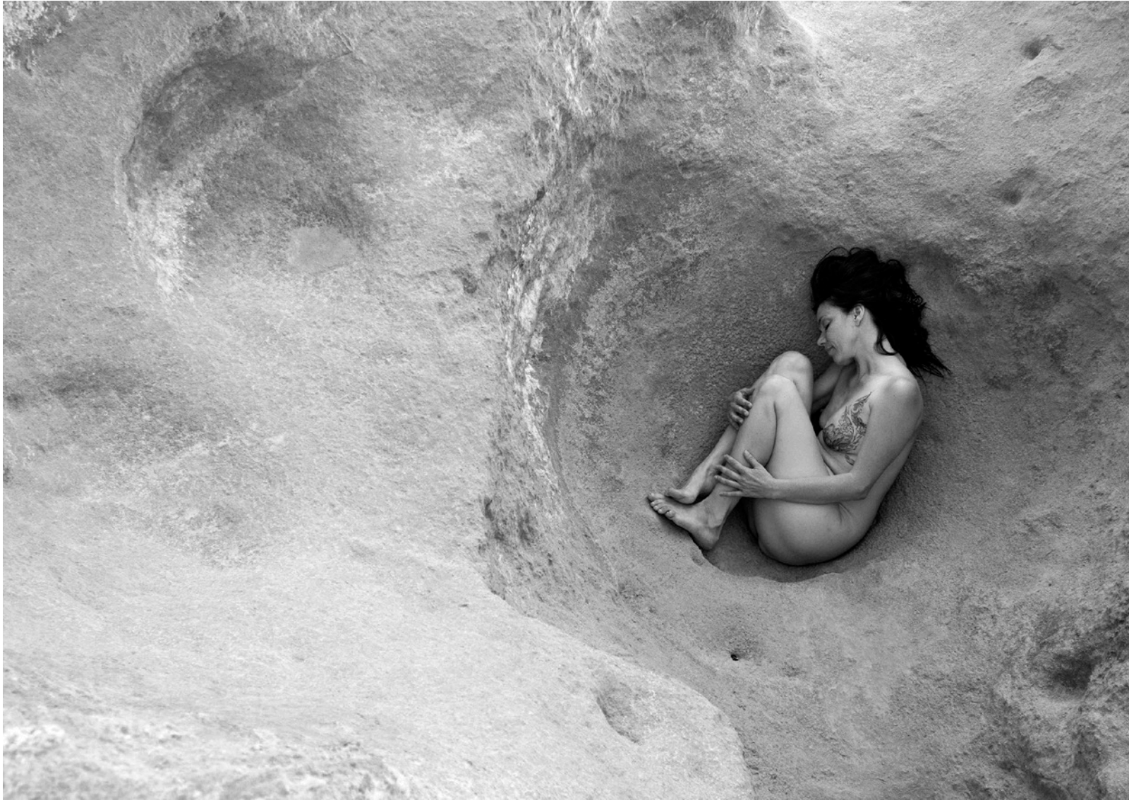
En mi utero conecto con mi niña (2017) 50cm x 32cm