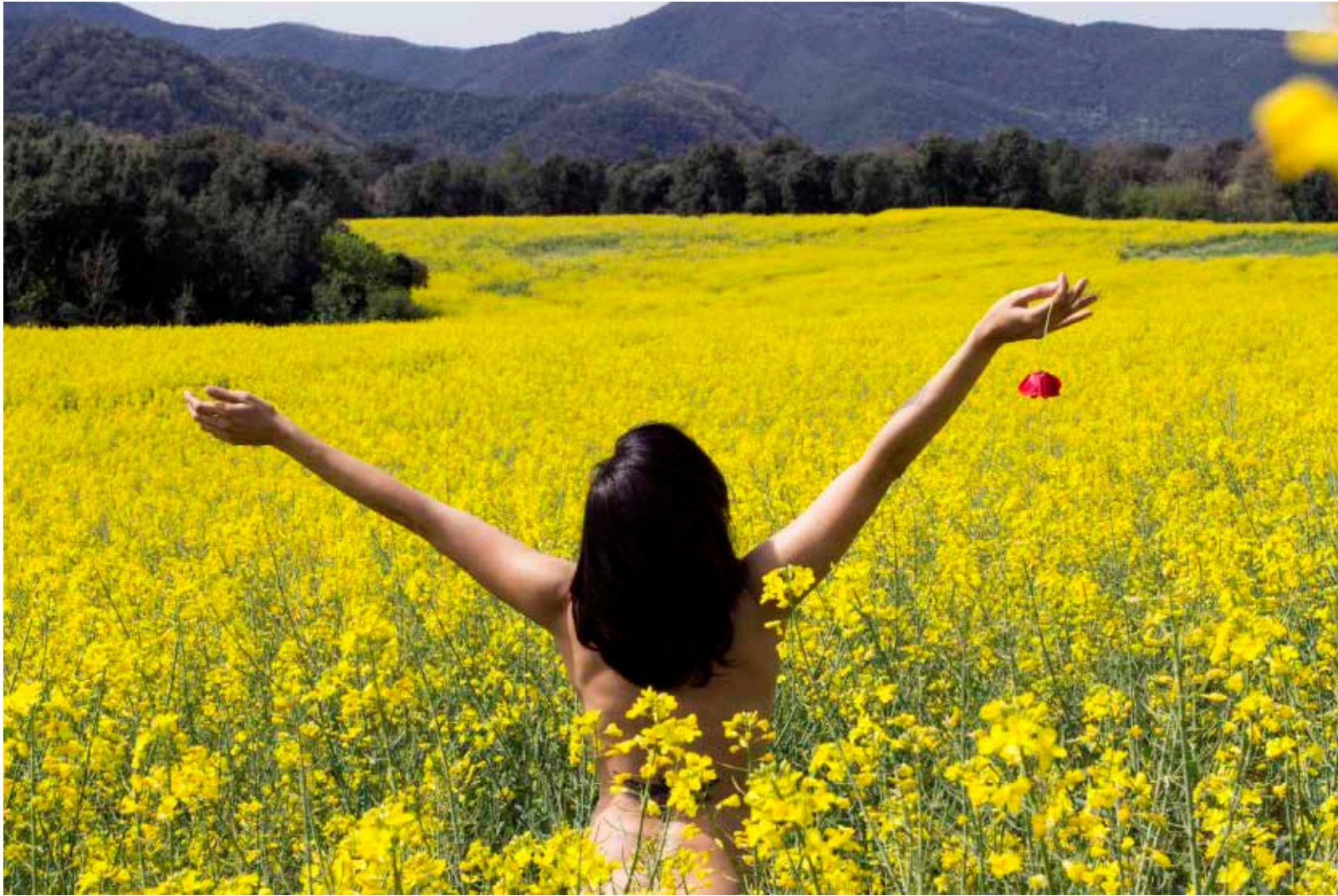
Hemos volado por el aire como los pájaros y nadado por el mar como los peces, pero aún tenemos que aprender el simple acto de caminar por la tierra como hermanos (2016) 50cm x 32cm