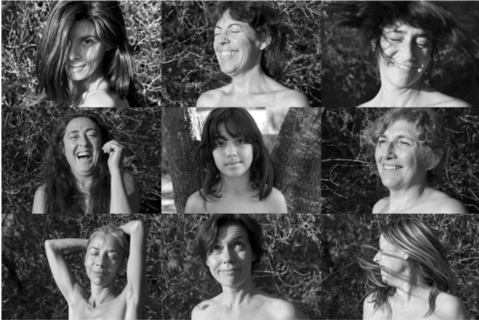
Serie2. No deseo que las mujeres tengan poder sobre los hombres, sino sobre sí mismas (2017) 50cm x 32cm