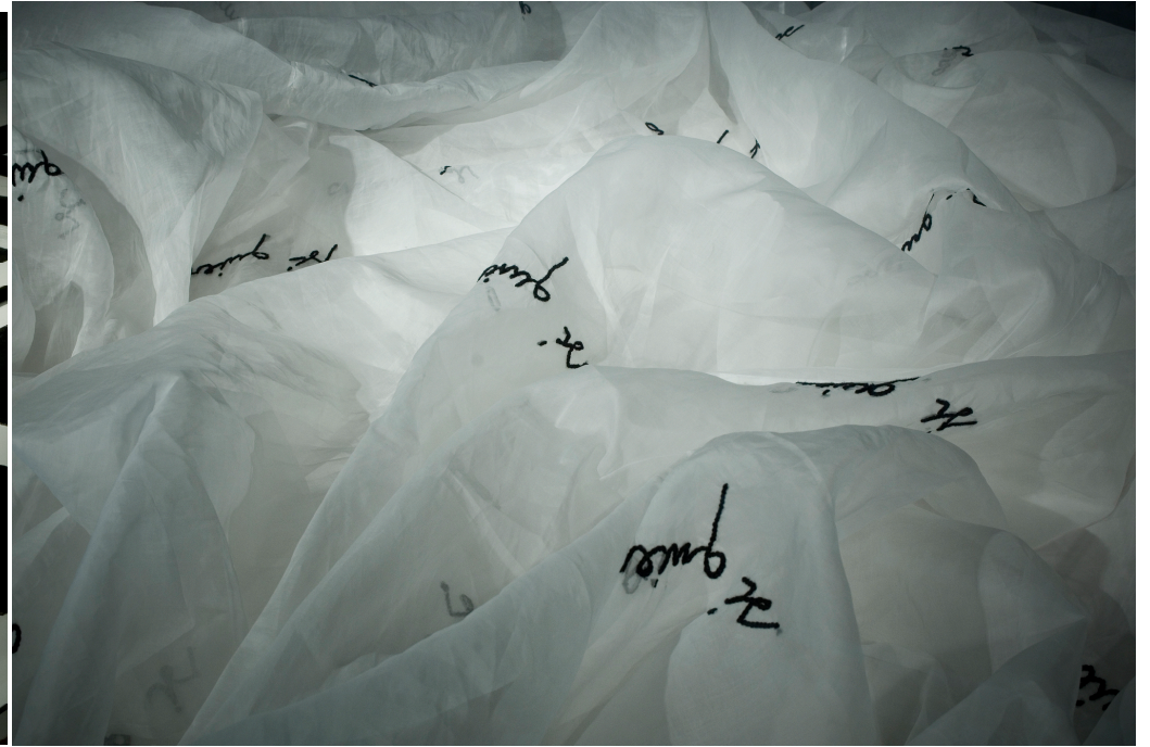
“Sargir l’ Anima” (2010) Exposición individual en el Centro de Documentación y Museo Textil de Terrassa (Cataluña).

“Matas ha estat sempre disposada a manifestar-se en contra d’ aquesta lacra de la societat que es la discriminació, la qual sembla que no podem eliminar de la quotidianitat”. M.J.Corominas.