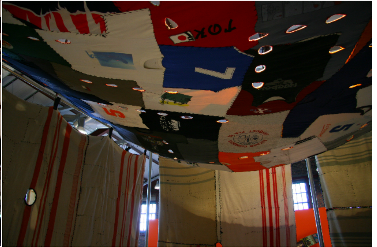
“Para ver el cielo” Instalación. In-Flux: Scotland '09. Summerlee Museum (Coatbridge)