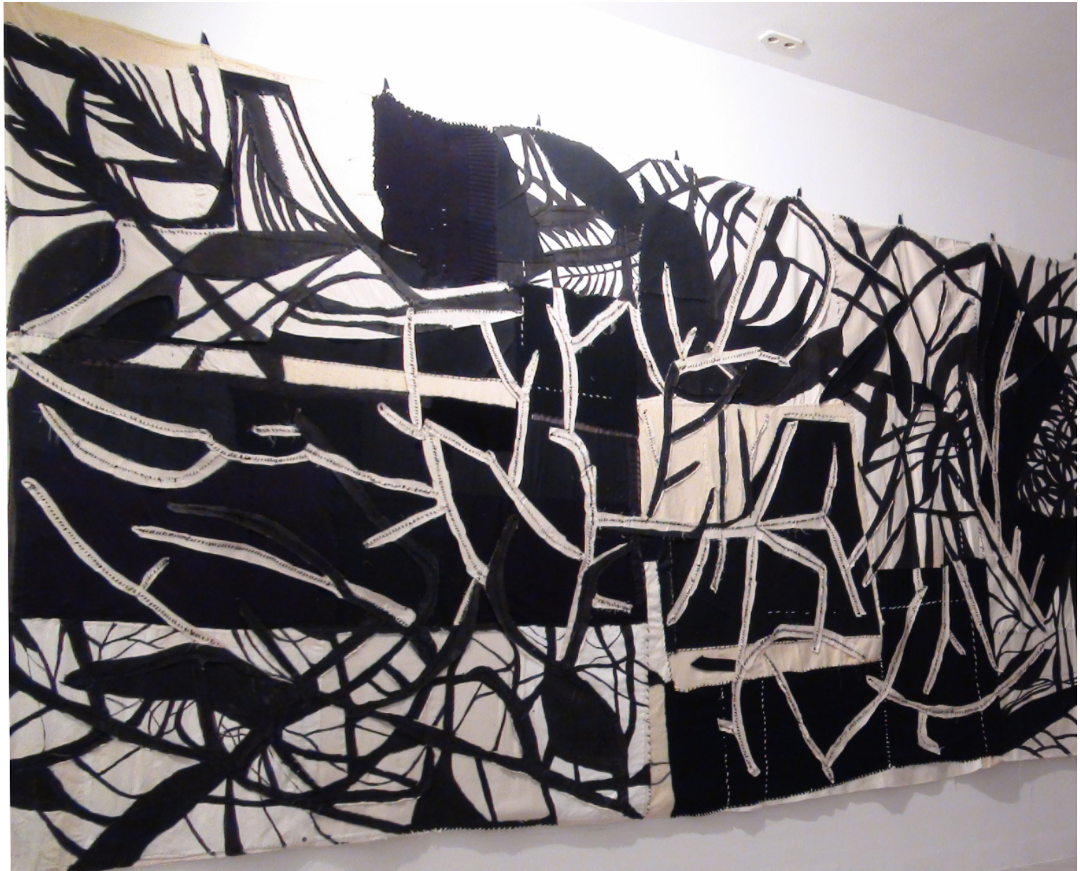
Galería Lluç Fluxà Espai HC "El Jardí" (2011).

Jardín y paisaje de sombras, un concepto unido simbólicamente al cuerpo del alma, la parte oculta y oscura de las cosas, ese lugar inaprensible donde conviven los miedos, los deseos o las angustias.