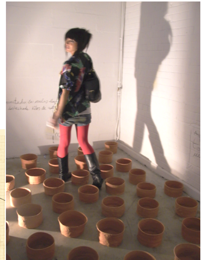
“Dejar Huella” Instalación en la exposición colectiva “In-Flux: Visiting Artists in London” (2008) en The Old Truman Brewery. Barrio londinense de Brick Lane. “Desallotja le por de la teva vida, junts en el vessament, buidem el terror” T. M.