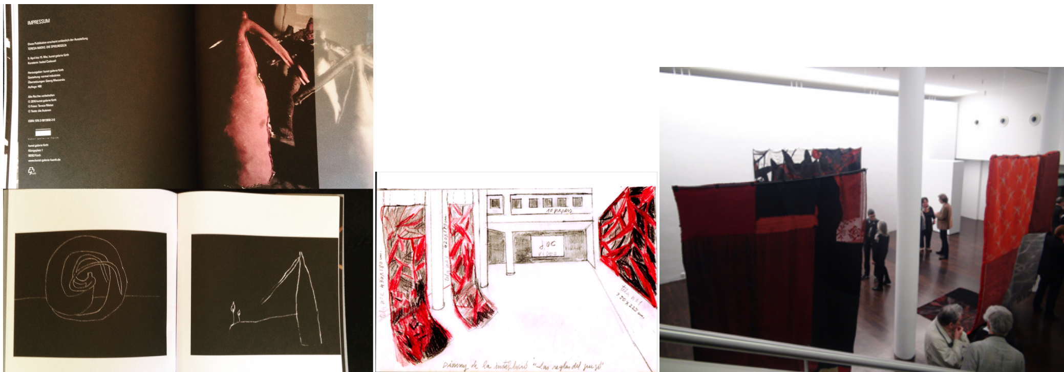
“Die Spielregeln” 2016 Kunst Galerie Fürth (Alemania)