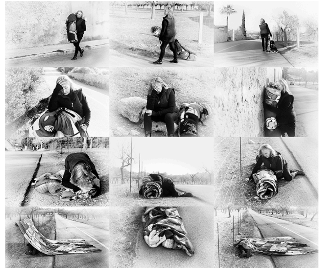
“L’Encontre” 2013 (vídeo) II Festival Miradas de Mujeres. Proyección en el exterior del Centro Comercial C&A de Palma.

“Sea cual sea el medio escogido – y son muchos y variados, abarcando desde la pintura y la escultura a la instalación y el video — Teresa Matas es, en esencia, una artista de performance. Sostener eso es decir que la performance yace en el corazón de su práctica artística y que hace uso de cualquier medio como parte de una visión de trabajo mucho más amplia. Matas no plantea la performance en pro de una finalidad artística, sino que parece estar comprometida con el proceso – con el acto de hacer la obra y la naturaleza de los materiales y las acciones que implica”. Proceso, Tiempo, Repetición y lo Sagrado (fragmento) por William Jeffett