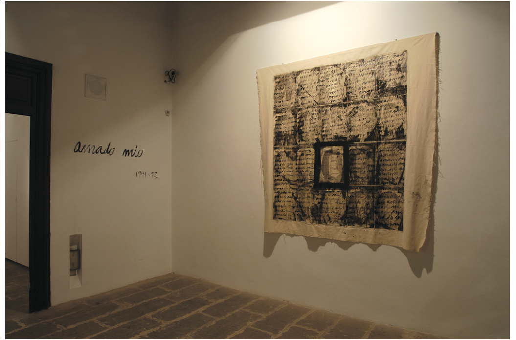
“Abriendo, cerrando, cerrando abriendo” (1991-2006) Retrospectiva. Planta Noble del Casal Solleric de Palma.