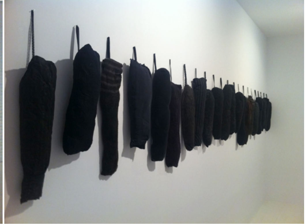
Scissors (2012), L21 Gallery. Palma.

“Asunción del dolor en un escenario extrañamente fúnebre pero en el que no es posible encontrar aquel cadáver de la verdad que querían los postmodernos” SCISSORS (fragmento) por Carlos Jover