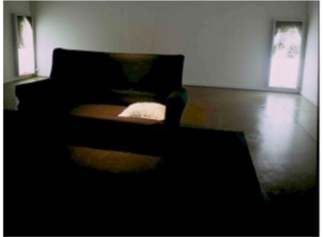
“Núm.55.Baixos” (2002) videoinstalación. Fundació Pilar i Joan Miró a Mallorca” en su ciclo “La Caverna de Platón: Reflexiones

Reflexión sobre los conceptos alegóricos del Mito de la Caverna de Platón (Libro VII de La República): encierro, liberación y encuentro con la realidad